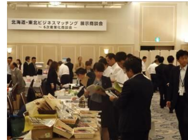
商談会の様子(平成26年6月)

今回は、平成25年11月に開催した「東北・北海道6次産業化ビジネスフォーラム」の参加企業を個別にフォローし、商談成約や新事業展開に向けたバックアップを実施したことが特徴です。