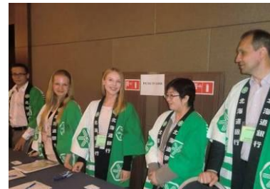
交流会の様子(平成26年6月)

ウラジオストク海外駐在員事務所開設(平成26年3月)を記念し、当行ロシア室は北海道と「道銀ロシア極東ビジネス交流会」を開催しました。本交流会では、相互理解を深めるため、現地のビジネス視察や自社P