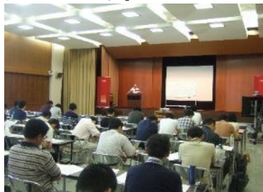
勉強会の様子(平成26年6月)

平成26年度上半期は「不動産」をテーマに、オフィスビル・賃貸住宅・ビジネスホテルの収益還元手法について講義を行い、403名の行員が参加いたしました。