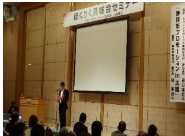
セミナーの様子(平成26年9月)

当行の会員組織である「ほくりく長城会」の会員向けセミナーの講師として、当行が業務提携を結んでいる中国江蘇省無錫市招商局より副局長をお招きし、無錫市の産業や経済を紹介いただきました。