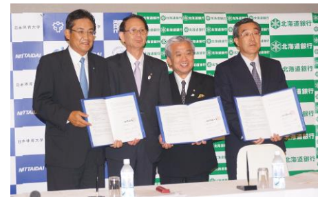
調印式の様子(平成26年8月)

学校法人日本体育大学、株式会社道銀地域総合研究所および北海道銀行の3者で、包括連携協定を締結いたしました。学校法人日本体育大学が網走市で計画する知的障害者特別支援教育の実践の中で、3者の相互協力によって、地域産業にマッチした職業訓練等の調査研究、卒業生の受け皿環境の調査や情報支援、また道内企業や医療機関との連携についての調査・研究・紹介などを行い、相互の発展、社会貢献、地域振興の実現を目指すものです。