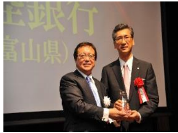
受賞時の様子 (平成26年6月)

中小・中堅企業M&A仲介機関大手の(株)日本M&Aセンターと連携し、富山・高岡・石川・福井の4会場で個社別株価診断会を実施しました。また、多くのM&Aニーズを発掘し、事業承継問題を解決するM&Aを成約したとして同社から表彰を受けました(平成25年度実績)。