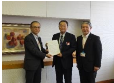
富山県中小企業診断協会との提携 (平成26年9月)

北陸・北海道地区において、各地区の中小企業診断(士)協会との業務提携を行いました。地域事情や該当業種にも理解のある地元の中小企業診断士による、事業計画策定やモニタリングなどのサポート体制を強化しました。