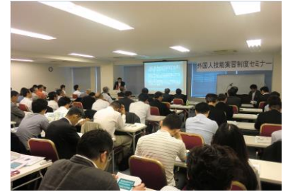
セミナーの様子(平成26年7月)

公益財団法人国際人材育成機構の協力のもと、外部から講師を招き、外国人技能実習制度にかかるセミナーを開催しました。北海道においても建設業を中心に人材不足は深刻な問題であり、東南アジアなどから実習生を受け入れ活用して