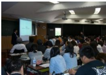
金沢大学での講義の様子 (平成26年5月)

平成26年度上半期は、金沢大学や富山大学において、前期通期で講義を実施し、金沢工業大学・金沢星稜大学・富山県立大学においても1～6コマの講義を実施しました。当行では、将来の地域を担う若い世代への各種教育を通じ、長期的視野での地域貢献に資する取組みを行っております。