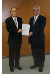
調印時の様子 (平成26年5月)

道内における中小企業の健全な発展を図るため、北海道税理士会と中小企業支援に関する覚書を締結しました。この覚書には北海道税理士会と当行が中小企業支援等に係る業務を通じて、北海道経済の発展に寄与することを目的に、相互に協力し活動することを織り込んでおります。本提携により、お取引先の経営改善、資金調達能力強化に繋がると考えており、これからも地元地域への円滑な資金供給および発展に貢献してまいります。