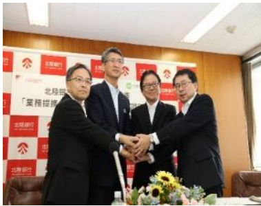
調印時の様子(平成26年8月)

平成26年8月、創業支援、ベンチャー企業支援、農商工連携、経営革新等、中小企業者、農林水産業者の振興に資することを目的に日本政策金融公庫富山支店、金沢支店、福井支店と連携協定を締結しました。互いの強みを活かして連携を図り、協調融資等をはじめとした、地域経済の活性化に資する取組みを進めてまいります。