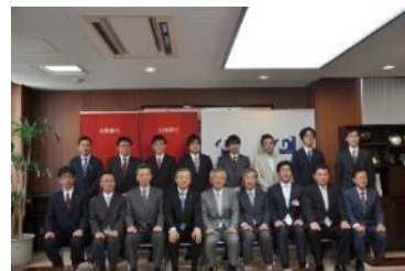
富大ほくぎん若手研究者助成金贈呈式 (平成26年5月)

金沢大学・富山大学において若手研究者に各々500万円を毎年助成しております。将来有望な若手研究者への支援を通じて学術研究発展に寄与する取組みを継続して実施しております。