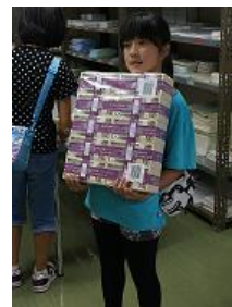
銀行体験の様子 (平成26年8月)

小学生とその保護者の方を対象とした「夏休み親子で銀行体験」を札幌、函館、小樽、室蘭、苫小牧、旭川、釧路、北見、帯広の道内9都市で開催しました。