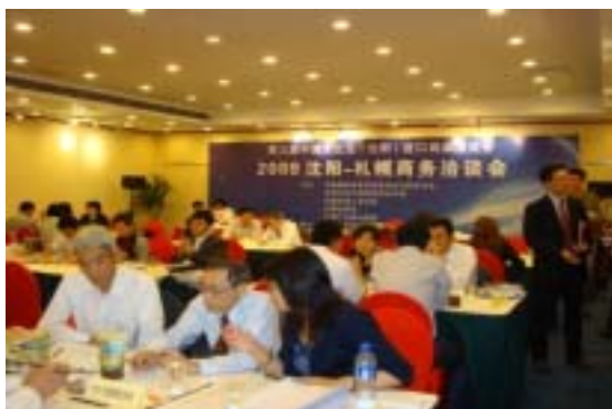
熱気溢れる商談会の様子 (21/9)

9月11・12日に瀋陽市にて開催された「第3回中国北東アジア輸入商品博覧会」の前日にホテル会場にて中国企業との商談会を開催、参加した様々な業種の道内企業との間で熱のこもった商談が行われました。