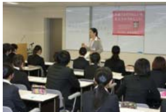
大学生向けの就業体験 44名の大学生が参加 (21/7)

大学生向けのインターンシップ、小中学生向けの就業体験等を通じて、地域を担う若い世代への金融知識普及を行いました。