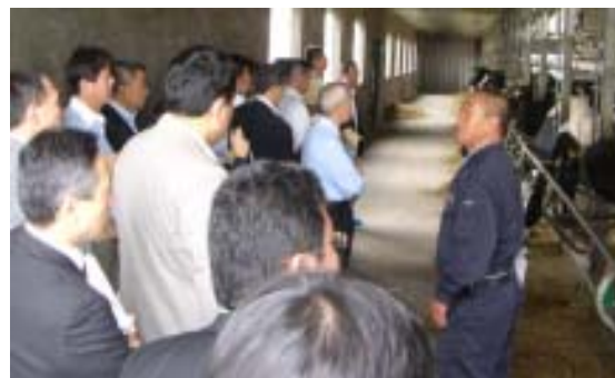
23社のバイヤーが参加。生産現場見学の様子 (21/7)

バイヤーがその生産プロセスを確認、製品の品質をその目で確認し、さらに販売するためのノウハウも助言することで、生産者、バイヤーの双方が同じ目線で会話する有意義な商談会となりました。