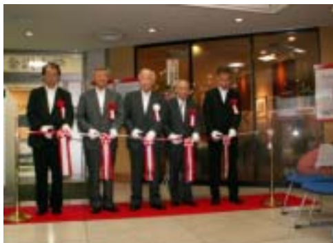
金沢大学東京事務所の開所式の様子 (21/7)

情報発信の中心地である東京におけるお客さまの情報収集活動をサポートすべく、当行の広域店舗網を活用し、東京支店の一部を地元大学の事務所として提供。