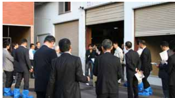
農業生産者のための北海道の「食」特別商談会in上川 (22/10)

北海道の「食」をテーマにした商談会を札幌、函館、旭川の3都市で開催。生産現場の視察を交え、安心・安全な道産食材の商談が行われました。