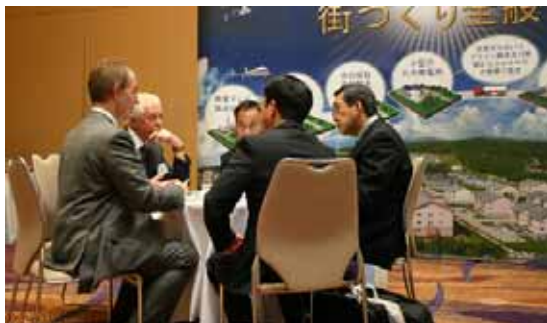
展示商談会での商談の様子 (22/5)

極東ロシアとのビジネス交流を目的とし、ロシアから極東地区の地元企業14社を招聘し展示商談会を開催。平行して貿易実務や商談の進め方をテーマとしたセミナーを開催し、ビジネス情報を提供も実施しました。