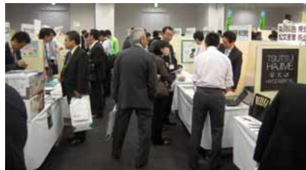
2,600名超の来場者による活発な商談が実現 (22/7)

業務提携を行う大垣共立銀行と共催で、「食」と「環境」をテーマとした商談会を開催。東海・北陸地区のビジネス交流を側面支援。