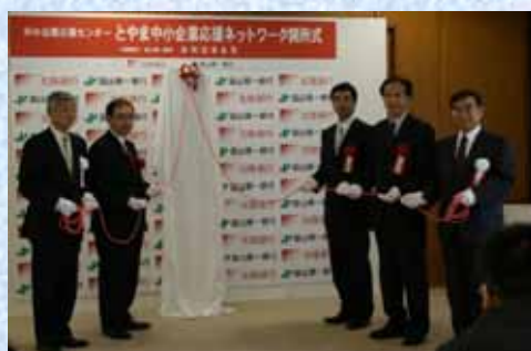
とやま中小企業応援ネットワーク開所式（22/4）