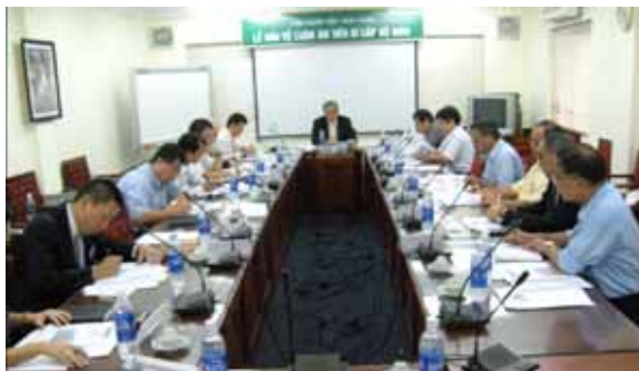
ハノイで行われたセミナーの様子 (22/5)

業務協力協定締結先のベトナム計画投資省と協力し、現地の法律やビジネスの最新事情に関するセミナー及び企業交流会を開催しました(百五銀行共催)。